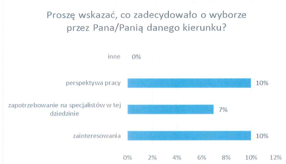
Wykres nr 4 Graficzna prezentacja wyników odpowiedzi na pytanie nr 4

Graficzna prezentacja wyników na pytanie nr 4 przedstawiona jest na wykresie nr 4.