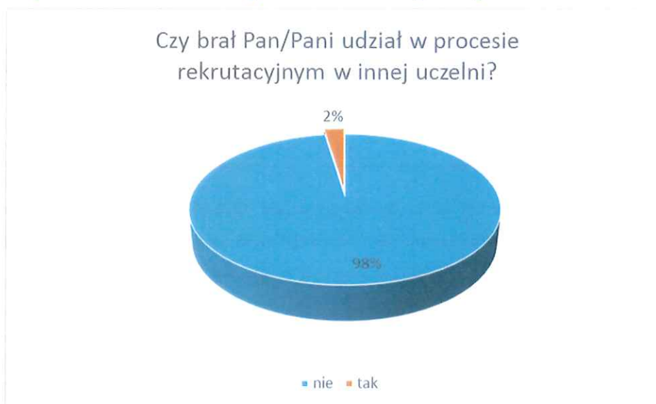
Wykres nr 2 Graficzna prezentacja wyników odpowiedzi na pytanie nr 2

W badaniu na Wydziale Nauk o Żywności i Rybactwa jedynie 2% respondentów deklaroowało udział w procesie rekrutacyjnym na innej Uczelni, wskazało 1 uczelnię w kraju (Uniwersytet Przyrodniczy w Poznaniu 1 wskazanie).